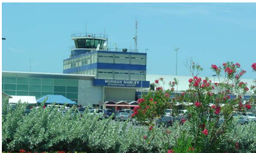
首都诺曼·曼利国际机场

中国赴牙买加没有直航，可经美洲或欧洲中转，通常中转地为美国纽约、加拿大多伦多、德国法兰克福和英国伦敦，其中，除途经法兰克福不须办理中转签证外，中转其他国家均须办理中转签证。