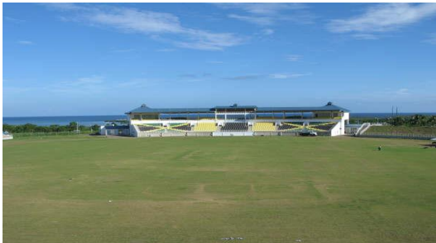
中国成套设备总公司承建的牙买加垂洛尼多功能体育场

据中国商务部统计，2020年中国企业在牙买加新签承包合同4份，新签合同额5847万美元，完成营业额2.05亿美元。累计派出各类劳务人员84人，年末在牙买加劳务人员541人。