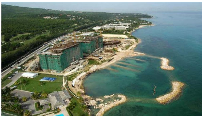
上海中远建设总承包公司承建的帕美拉酒店