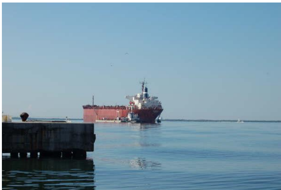
宁静的金斯敦港湾