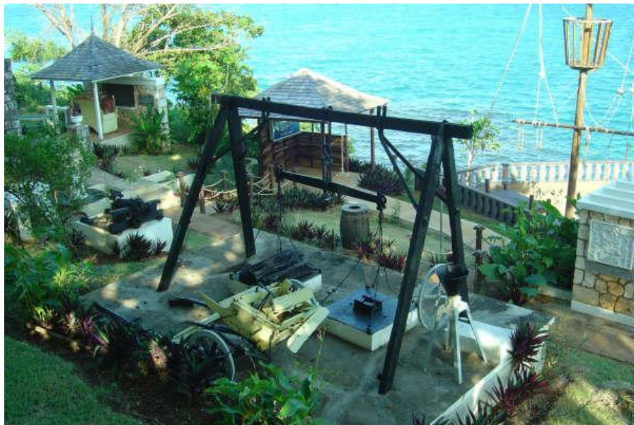
1494年哥伦布在牙买加北岸登陆的地方