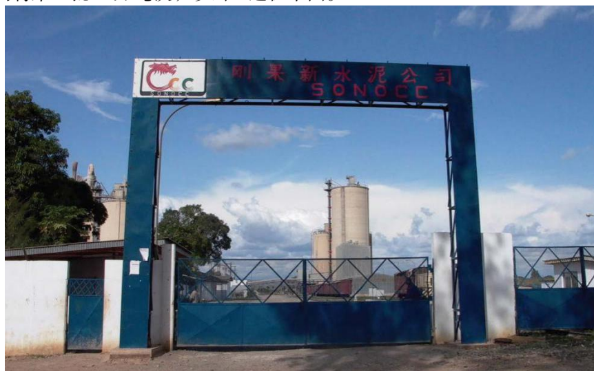
中国路桥与刚方合资建成年产30万吨刚果新水泥厂

刚果（布）主要矿产开发项目进展情况：中国黄金控股的刚果（布）索瑞米公司电解铜项目于2017年7月正式投产。受限于铁路和港口等基础设施不足，由西方或南非公司把持的大型铁矿项目均未投产。2019年4月，由刚果（布）与英国—瑞士矿业公司GLENCORE合资开办的Sapro矿业公司将第一批2.3万吨铁矿砂出口运往中国。