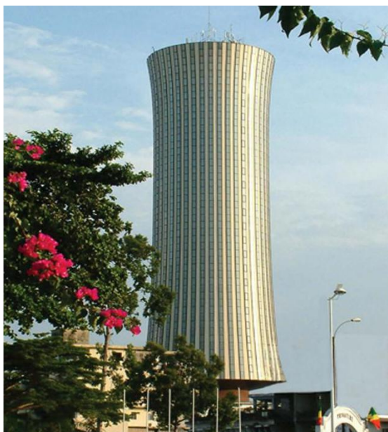
政府办公楼（当地称作“腰鼓楼”）

部；安全和公共秩序部；矿业和地质部；领土整治、基础设施和道路养护部；石油天然气部；外交、法语区和海外侨民部；国防部；财政、预算和国库部；新闻和媒体部；高等教育、科研和技术创新部；学前、初中等教育和扫盲部；司法、人权和土著民族促进部；中小企业、手工业和非正规部门部；能源和水利部；土地事务和公产管理部；经济特区和经济多元化部；青年、体育、公民教育、专业技能培训和就业部；建设、城市规划和住房部；林业经济部；卫生和人口部；运输、民用航空和商船部；国际合作和促进公私伙伴关系部；邮政、电信和数字经济部；旅游和娱乐部；工业发展和私营部门促进部；环境、可持续发展和刚果盆地部；技术职业教育部；社会事务和人道主义行动部；领土管理、地方分权和地方发展部；文化与艺术部；妇女促进和参与发展部；内政和地方分权部。